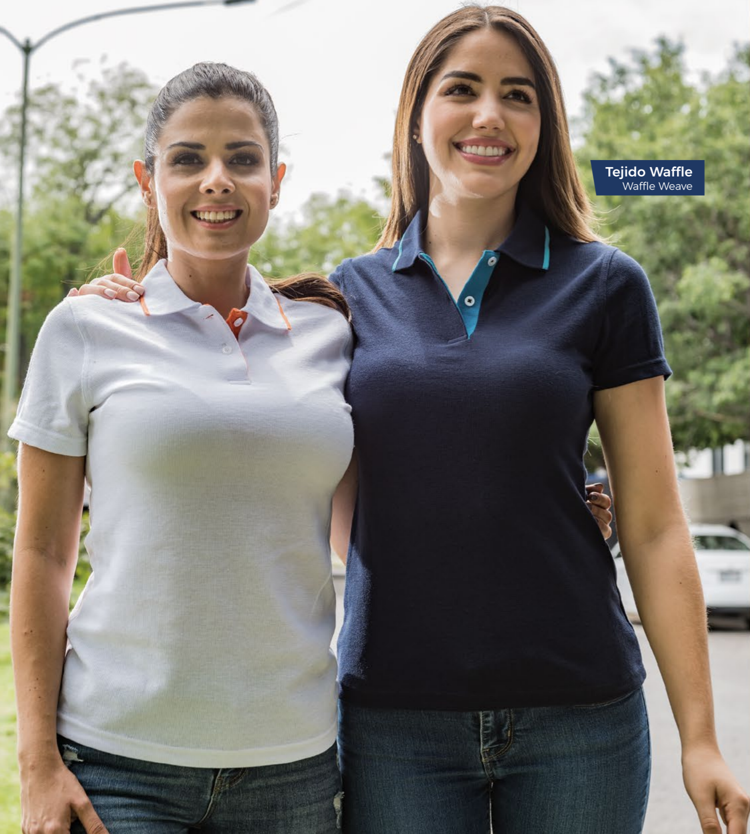
Tejido Waffle Waffle Weave